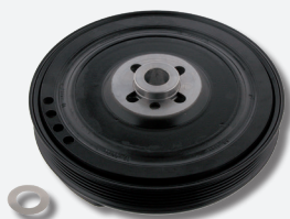
Zestaw naprawczy z tarczą diamentową