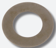
Tarcza z powłoką diamentową

Aby uniknąć kosztownych skutków zastosowania niewłaściwych części, tarcza diamentowa stanowi element zestawów naprawczych febi dla dwumasowych kół pasowych samochodów marek Volvo 850, S70, V70 I, V70 II, VW Crafter/ T4 oraz Audi A6.